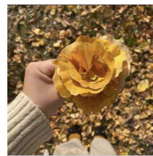
アイデア賞「幸せの黄色いブーケ」