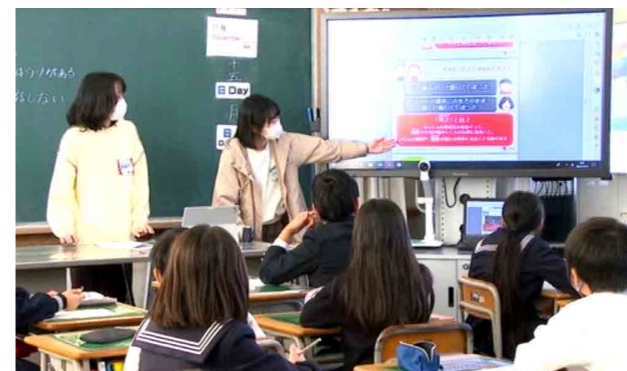
太田南小学校での教育活動

SETOKUの募集用ポスターを創造工学部 造形・メディアデザインコースの学生に協力してもらい作りました。もう流石としか言えない・・・センスが溢れまくってます！ってことで、このポスターを見かけたら応募してください!!!。