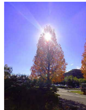
特別賞「見え隠れ 楓の先に 精霊か」