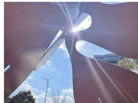
アイデア賞「隙間から」