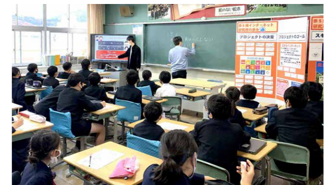
香川大学教育学部附属高松小学校での教育活動