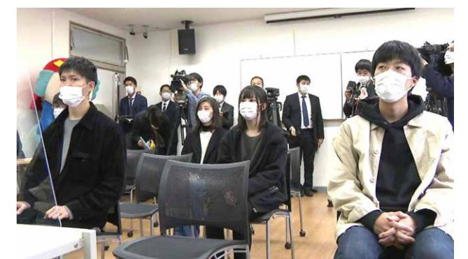
結成式でのSETOKU団員。多くの報道陣が取材に来てくれました。