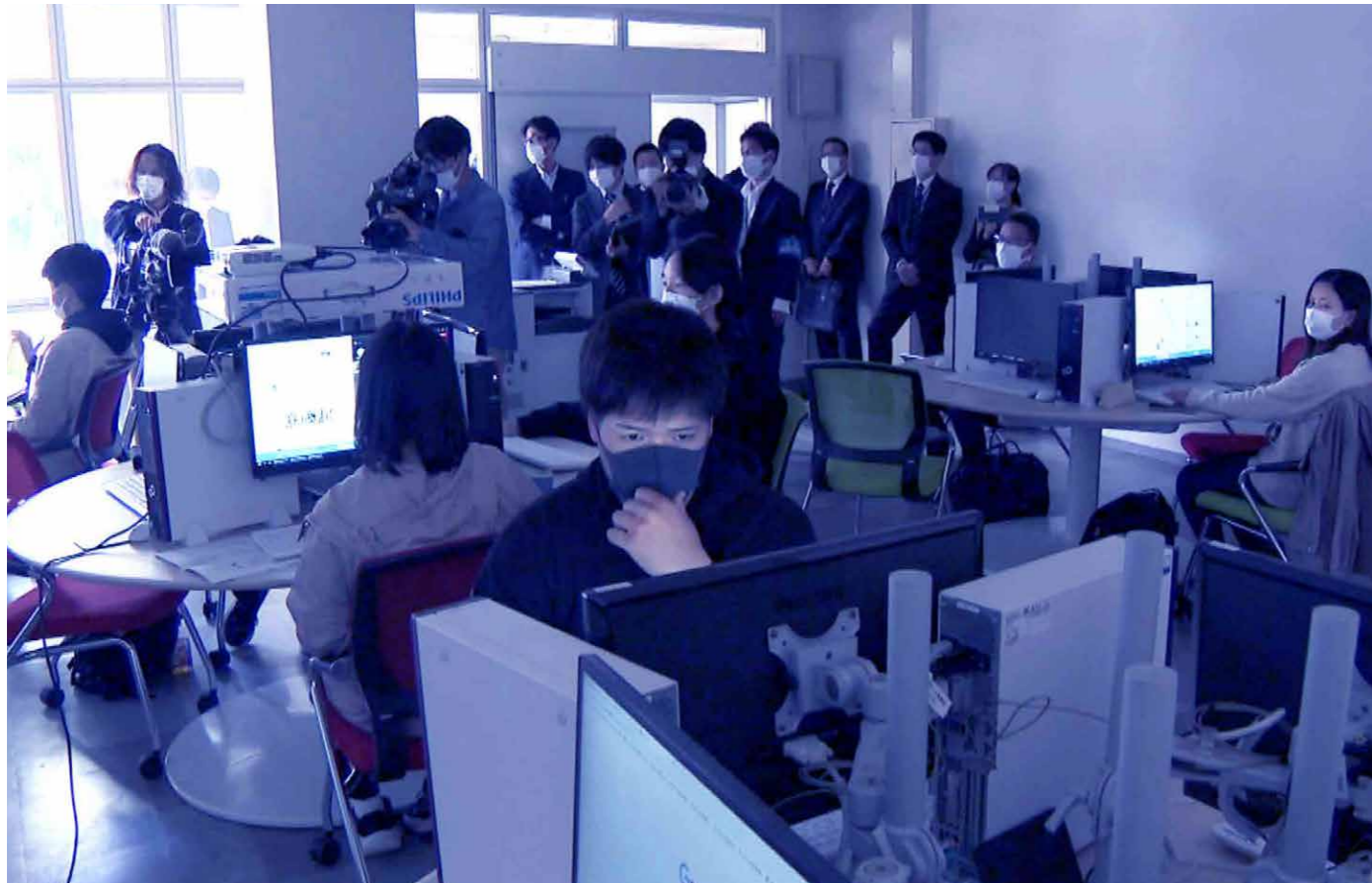
一般財団法人 日本サイバー犯罪対策センター (JC3) の協力によるサイバー空間の浄化活動の講習会

「SETOKU」とは (SEcurity Team Of Kagawa University) の略称で私たちは、サイバーセキュリティ分野における安全・安心な地域社会の実現を目的として活動を行っています。インターネット上における違法・有害情報の氾濫や偽サイト・詐欺サイトによる被害は社会問題となり、サイバー空間の脅威は増加しています。そこでSETOKUは香川県警察や日本サイバー犯罪対策センター (JC3)、トレンドマイクロ株式会社など様々な方からご支援・ご協力いただき香川県の安全・安心のため ① 犯罪被害防止のための教育活動 ② 広報啓発活動 ③ サイバー空間の浄化活動、に取り組んでいます。